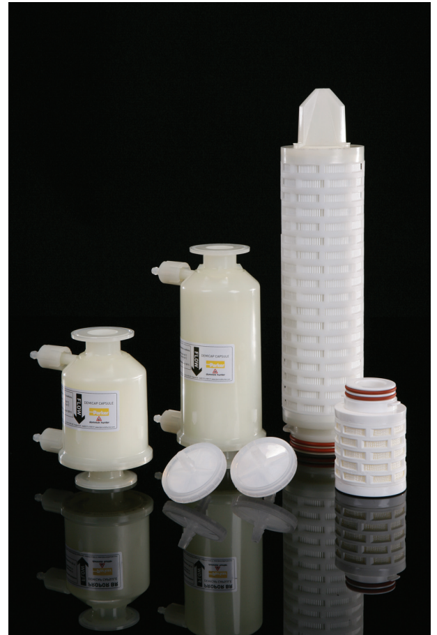
Примечание: PEPLYN является зарегистрированной торговой маркой компании Parker domnick hunter