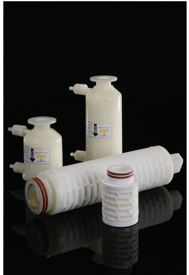
Примечание: PREPOR является зарегистрированной торговой маркой Parker domnick hunter